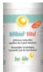
Ouderen vanaf 50 jaar