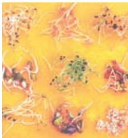
Alfalfa - Tarwe - (Dille) - Groene Soja - Prei - Linzen Klaver-Zonnebloem-Quinoa