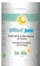
Kinderen tot 8 jaar

BIFIBIOL VITAL 60 caps: 16,81 -5%= 15,96 €