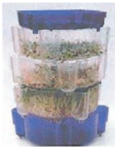
Kiemapparaat 3 niveau's

Het kiemen is makkelijk in een kiemapparaatje. De zaadjes worden dagelijks overgoten met water. De restanten van het water laat men in het onderste schaalpje, dit geeft nog een beperkte vochtafgave aan de scheuten. Voor men de zaden in het kiemapparaatje doet kan men ze enkele uren of een nacht laten weken in water. De groeitijd is afhankelijk van de grootte van de zaden en de gewenste grootte van de kiemen, dit kan enkele dagen, tot een week duren. Het laten kiemen kan zowel in een lichtere als in een meer donkere ruimte.